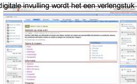
Interne wiki Bibliotheek Vlissingen

“Daarnaast hebben we in de bibliotheek een interne wiki als kennisdelingsplatform. Een deel daarvan is ingericht voor de functie ‘romanadvies’. Op die plek kunnen medewerkers hun kennis met elkaar delen en samen werken aan themalijsten en boekenleggers”.