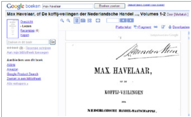
Figuur 1. Een voorbeeld van een publiek domein-werk in Google Books.